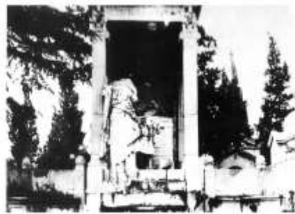
То едот Агаев е во процес на собирање на Топанантиса Ајанс-Дарантисе Сиперантисе. The magnificent end of the pulpit (above) St. Demetrios, the altar-headed with a reverence and broken to concrete.