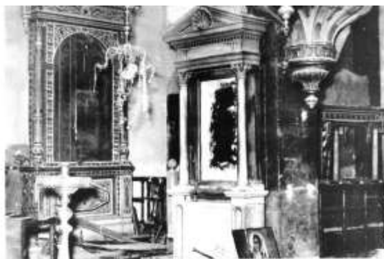
То едот Агаев е во процес на собирање на Топанантиса Ајанс-Дарантисе Сиперантисе. The interior (above) and the partial (below) of the same church when the debris is out of the concrete.