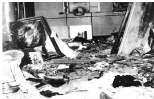
То едот Агаев е во процес на собирање на Топанантиса Ајанс-Дарантисе Сиперантисе. The destroyed nave bary (above) and precious candle stands (below) of the same church.