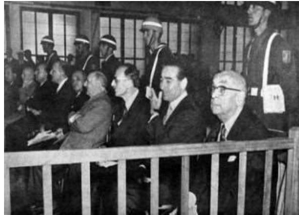
Οι δίκες της ν. Πλάτης 1960-61

Πρόσφατα με την δημοσίευση των πρακτικών της δίκης των Σεπτεμβριανών στην νήσο Πλάτης, που έγινε μετά από το πραξικόπημα της 27/5/1960, αποκαλύφθηκε ότι το σχέδιο της απέλασης των Εταμπλί Ελλήνων υπηκόων είχε σχεδιαστεί τουλάχιστο από το έτος 1957. Στη μόνη μυστική συνεδρία που έγινε κατά την διάρκεια των δικών ο μάρτυρας στρατηγός Ρεφίκ Τούλγκα κατέθεσε τα εξής: «...πριν αναχωρήσω για την Νάπολι σε υπηρεσία του ΝΑΤΟ, όταν πήγα να αποχαιρετήσω τον Πρόεδρο Τζελάλ Μπαγιάρ μου είπε πάνε και πες στους Αμερικανούς ότι είμαστε αποφασισμένοι να πάρουμε σκληρά μέτρα κατά των Ρωμιών της Πόλης και περισσότερο για τους 30.000 Έλληνες υπηκόους που διαθέτουν περιουσίες