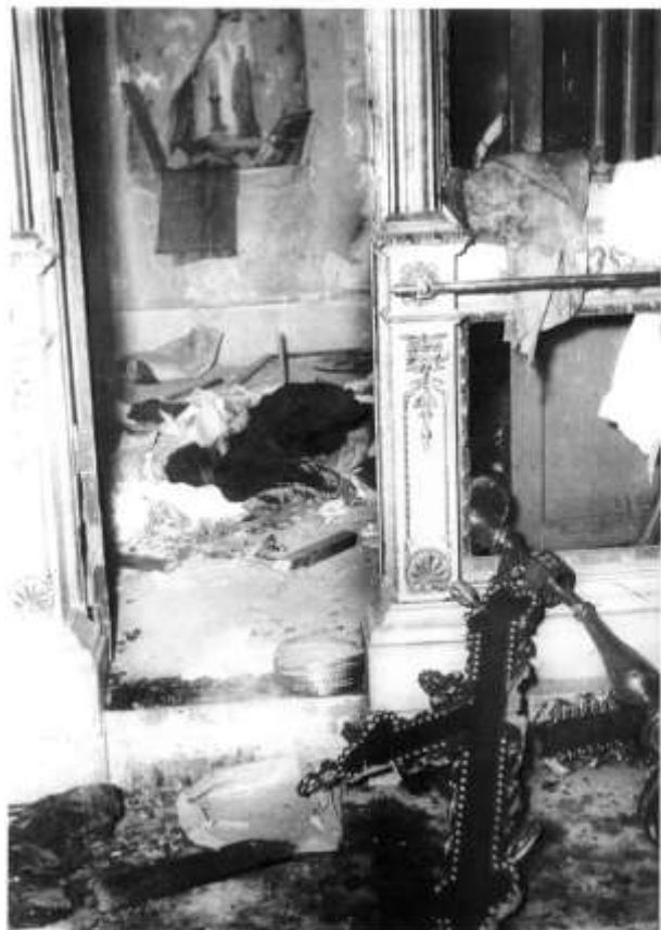
То едот Агаев е во процес на собирање на Топанантиса Ајанс-Дарантисе Сиперантисе. The nave bary and the losses of the altar across of the church of St. Demetrios at Revakovo.